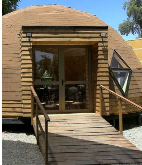
Domos Salud mental