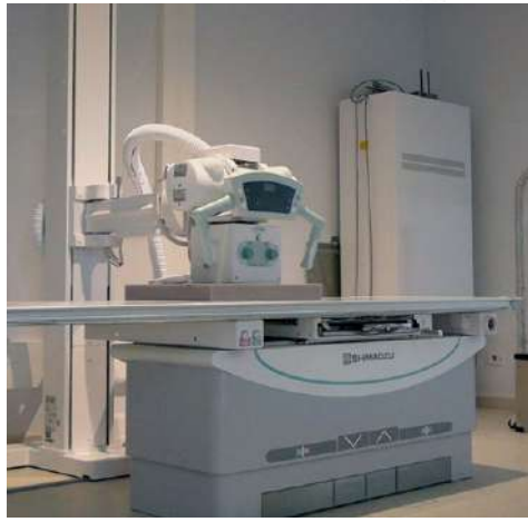
Sala Rayos X