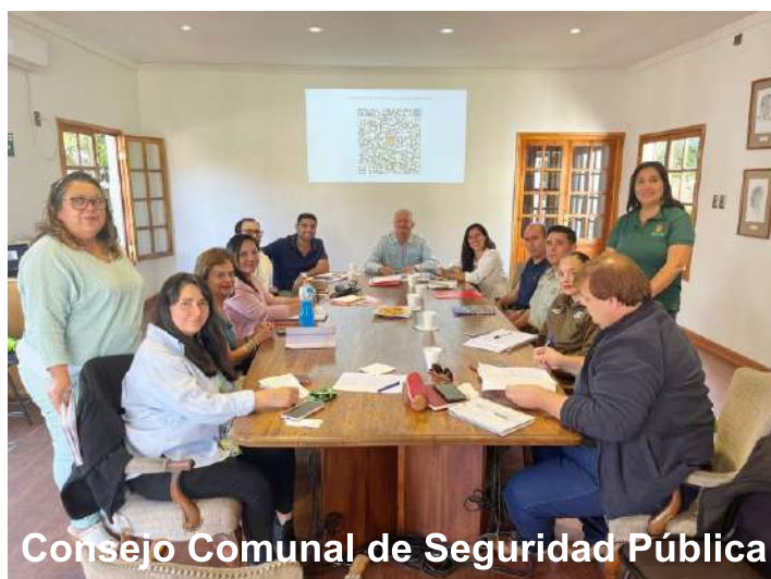
Consejo Comunal de Seguridad Pública