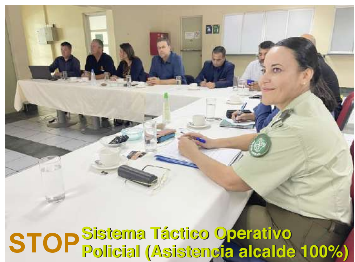
STOP Sistema Táctico Operativo Policial (Asistencia alcalde 100%)