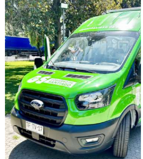
Vehículo para personas con movilidad reducida