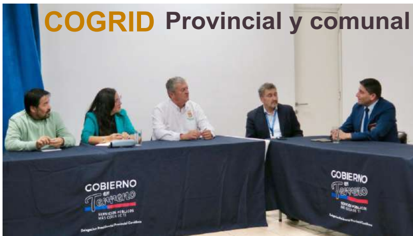
COGRID Provincial y comunal

Asistimos a diferentes instancias para fortalecer la Seguridad