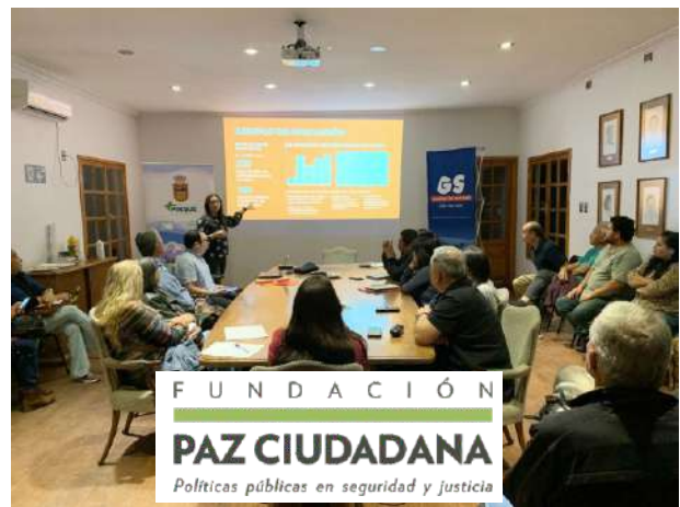
FUNDACIÓN PAZ CIUDADANA Políticas públicas en seguridad y justicia