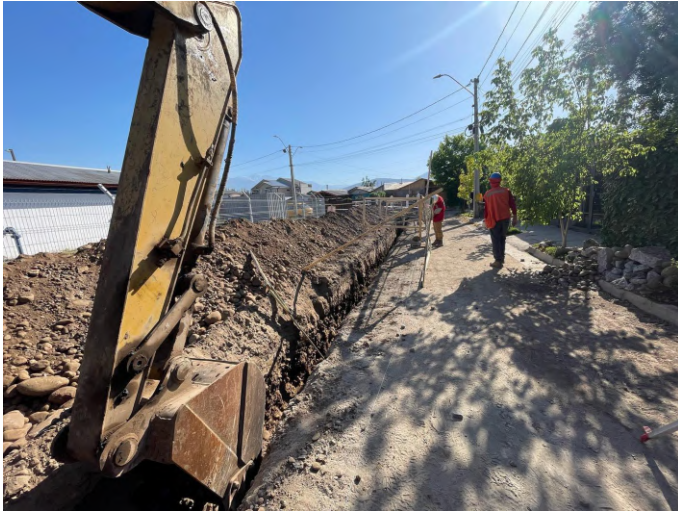
Obras de construcción de la futura Planta de Tratamiento de Aguas Servidas y Red de Alcantarillado Villorrio Alamos del Llano.

MEJORAMIENTO DE CAMINOS / SEÑALÉTICA LOMOS DE TORO / OBRAS DE AGUA POTABLE Y ALCANTARILLADO