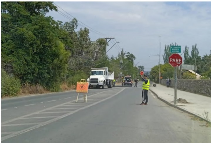
A pedido de la comunidad, comenzaron las obras de resaltos simples en Pirque. Para fortalecer la seguridad vial y reducir la tasa de accidentes, es que la comunidad solicitó la instalación de lomos de toro para enfrentar estas situaciones.