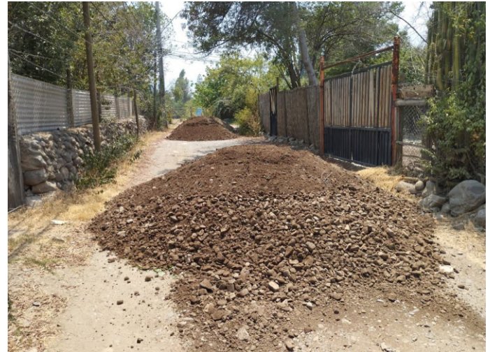
Mejoramiento camino Paradero 8 , Orilla de Río