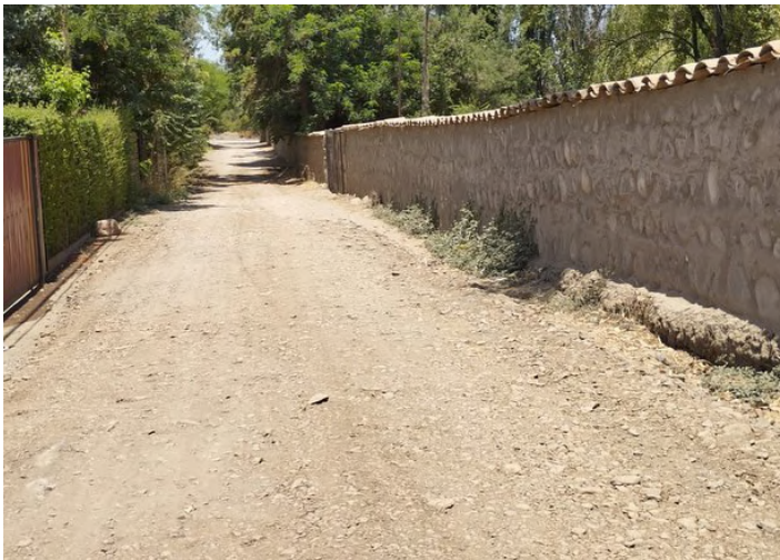
Mejoramiento camino paradero 9, 9 ½ y termino del paradero 11 de Orilla de Río en El Principal.