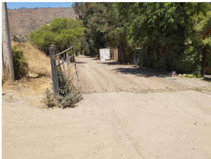
Camino Las Bandurrias en Lo Arcaya.