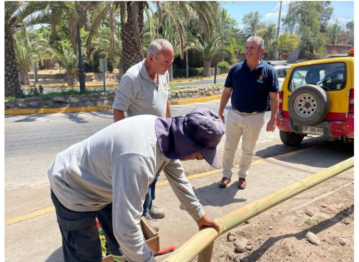
Arreglando los jardines de la vuelta a las Palmeras.