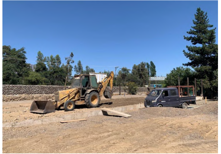
Construcción Feria productores locales