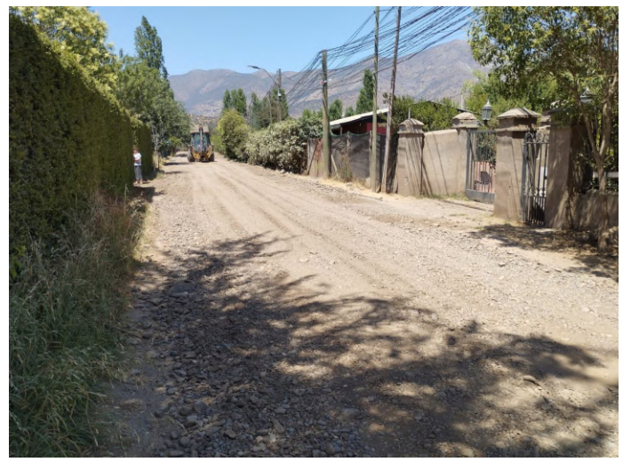
Camino Parcela 18, La Alameda, El Principal.