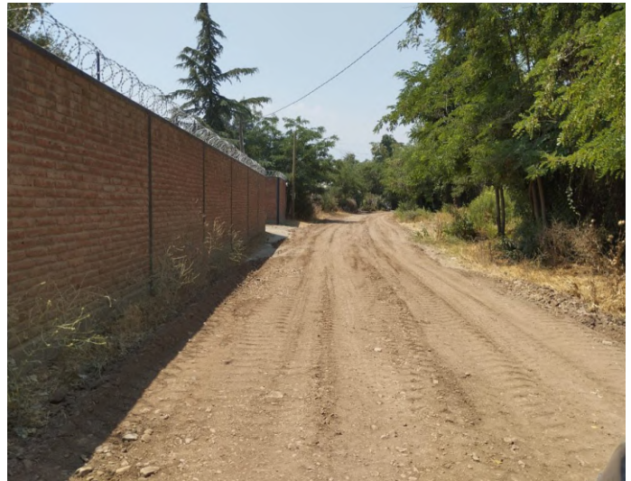
Camino La Higuera.