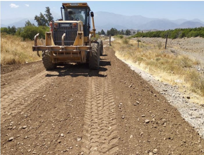
Camino Casas de Lo Arcaya.