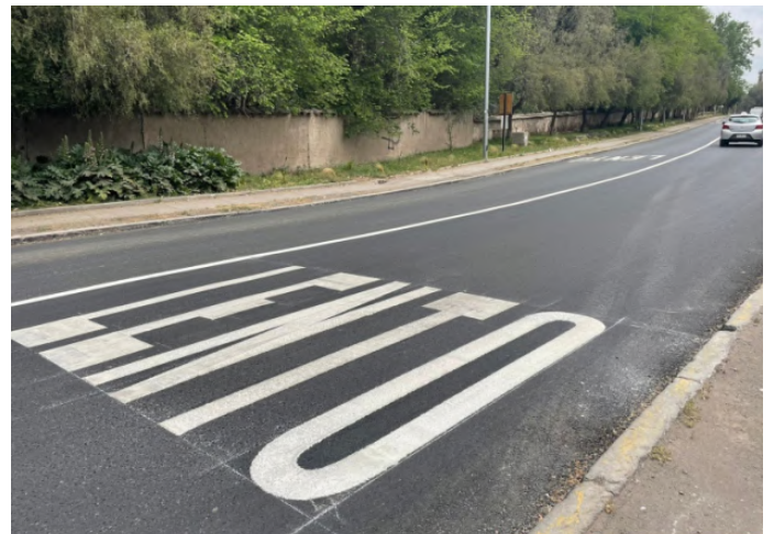
Mejoramiento pavimentación entrada Pirque