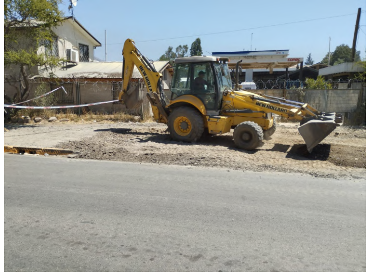
Mejoramiento sector cuatro esquinas