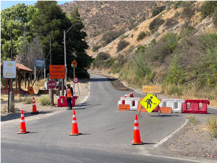
Pavimentación cuesta Los Ratones, San Vicente.