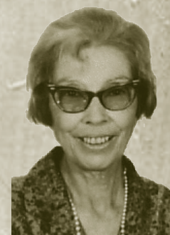
MARCELA PAZ / Escritora (1902-1985)