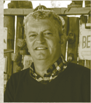
Jaime Escudero Ramos Alcalde de Pirque

E ste mes Pirque se viste de Fiesta y celebra sus 97 años. Años en los que cada persona y rincón de esta extensa comuna han creado la magia que convierte a Pirque en lo que es.