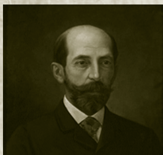
MELCHOR CONCHA Y TORO Empresario, Ministro y Senador (1834-1892)