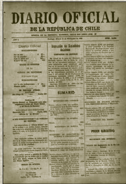
Diario oficial del 11 Enero de 1926 donde se publica el decreto ley 803 sobre las provincias y comunas del territorio.

Dicho esto, ¿por qué es importante que se rectifique y se conforme como fecha de creación de la comuna el 22 de diciembre de 1925?, no es algo antojadizo. Simplemente es porque existe un Decreto más antiguo y este tiene que prevalecer ante los demás. Un ejemplo de esto es en la comuna vecina de la Florida creada el 28 de Noviembre de 1899, para luego el 30 de diciembre de 1927 ser suprimida y pasar a ser parte del municipio de Ñuñoa. En 1934 se restituye como comuna de la Florida y en la actualidad la primera fecha es la que se celebra como aniversario de esta comuna.